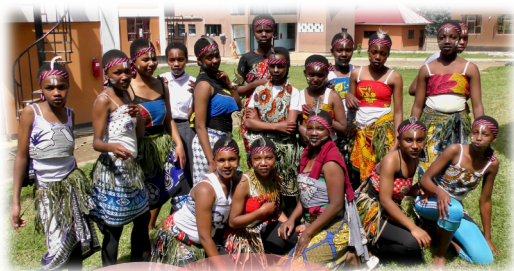
さくら名物! 伝統ダンスの衣装

さくら女子中学校は 現地のモデル校 になることを目指しており、JICA事業が実施完了した後の2022年以降も、その成果が着実に結実するよう、サポートを続けています。